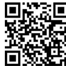
Szczegółowy opis wzmacniacza oraz dodatkowe schematy połączeń